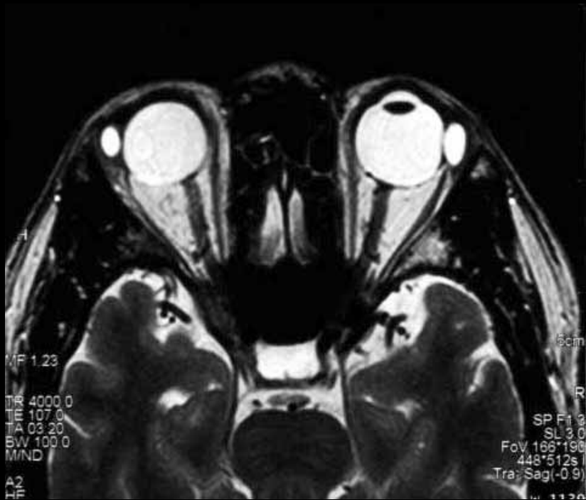
図1 T2強調横断像 FSE 180/4000/107(FA/TR/TE)