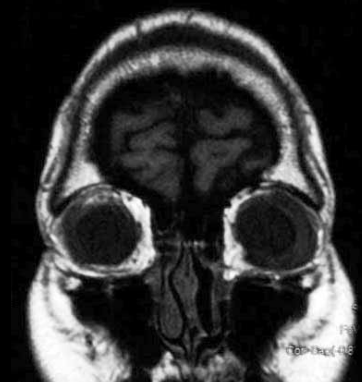
図4 T1強調冠状断像 SE 75/500/14(FA/TR/TE)