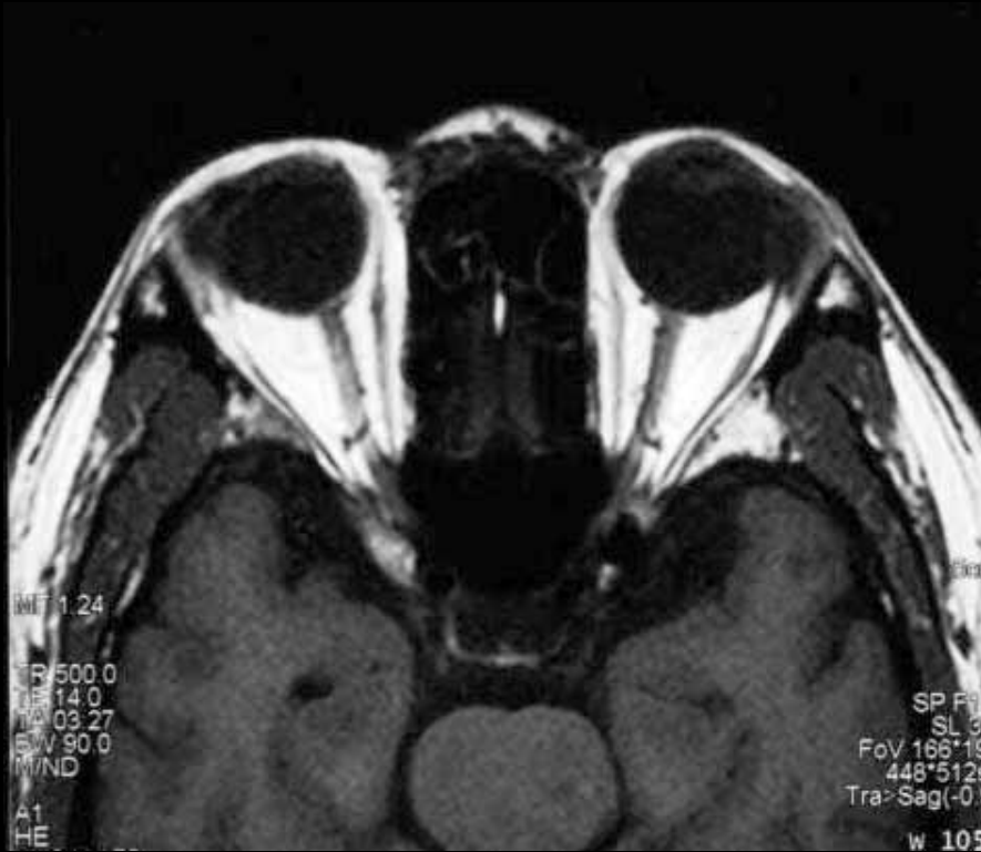
図3 T1強調横断像 SE 75/500/14(FA/TR/TE)